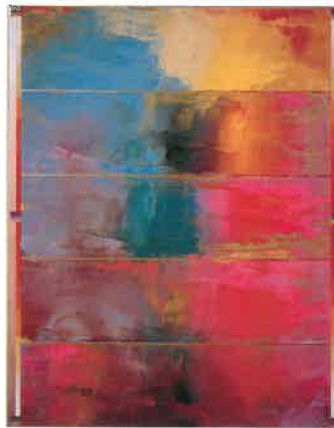
加納光於 《逃げ水-その行方を追ってVII》1981年

【学芸員によるギャラリートーク】日時/第1土曜日14:00より(30分程度) ※申し込み不要、ただし本展観覧料が必要です。