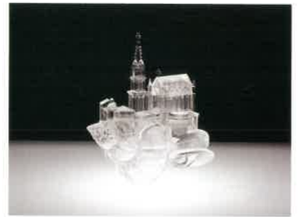
AKI INOMATA 《やどかりに「やど」をわたしてみる—White Chapel—》 2014年©AKI INOMATA courtesy of Maho Kubota Gallery