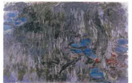
クロード・モネ《睡蓮、柳の反影》1916-19年