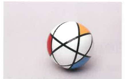
岡崎和郎《P.M.ボール》2004年