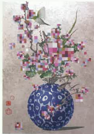
【参考図版】 田中武《咲き誇る情報》2022年